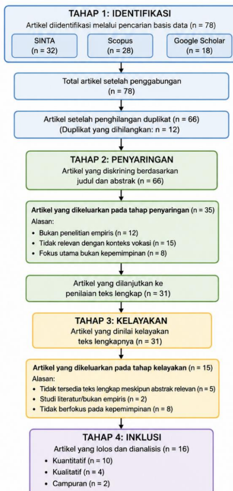
Gambar 1. Diagram PRISMA

Tahap identifikasi diawali dengan pencarian literatur pada tiga basis data: SINTA (n=32), Scopus (n=28), dan Google Scholar (n=18), sehingga total artikel yang teridentifikasi adalah 78 artikel. Setelah penghilangan duplikat sebanyak 12 artikel, tersisa 66 artikel yang dilanjutkan ke tahap penyaringan (Limbong, 2023; Prayogo et al., 2026b). Tahap penyaringan dilakukan dengan menilai judul dan abstrak dari 66 artikel oleh dua peneliti independen (Wenya & bin Mohd. Yusoff, 2025; Yuliana et al., 2022). Sebanyak 35 artikel dikeluarkan dengan rincian: 12 artikel bukan penelitian empiris, 15 artikel tidak relevan dengan konteks pendidikan vokasi, dan 8 artikel tidak berfokus pada kepemimpinan. Hasilnya, 31 artikel dilanjutkan ke tahap kelayakan. Tahap kelayakan dilakukan dengan membaca teks lengkap 31 artikel. Sebanyak 15 artikel dikeluarkan dengan alasan: 5 artikel tidak tersedia teks lengkap meskipun abstraknya relevan, 2 artikel merupakan studi literatur, dan 8 artikel tidak berfokus pada kepemimpinan meskipun konteksnya vokasi. Dengan demikian, 16 artikel memenuhi seluruh kriteria kelayakan untuk diikutsertakan dalam tinjauan sistematis. Tahap inklusi menghasilkan 16 studi yang dianalisis lebih lanjut, dengan rincian: 10 studi kuantitatif, 4 studi kualitatif, serta 2 studi campuran ( mixed methods ) yaitu.